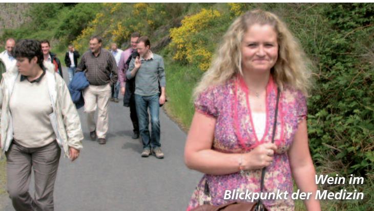
Wein im Blickpunkt der Medizin